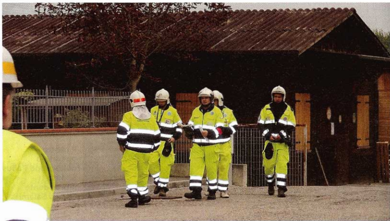
Intervento di evacuazione

un evento sismico, all'incendio di una barca, fino alla realizzazione di opere di contenimento per le piene del fiume. Infine, nel luglio del 2007, il gruppo è tra i primi ad accorrere nella vicina Guidizzolo, a seguito della catastrofica tromba d'aria che al suo passaggio provoca ingenti danni alle abitazioni e alle colture.