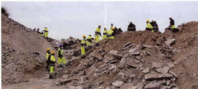
Esercitazione sul rischio sismico

supporto logistico in occasione dei funerali di papa Giovanni Paolo II, e dello straordinario afflusso di fedeli che si verificò. Nel 2006, inoltre, il gruppo festeggia i suoi primi dieci anni di vita attraverso un'imponente esercitazione, sempre ad Ostiglia, che coinvolge, oltre ai propri uomini, anche quelli appartenenti ad altre organizzazioni, per un totale di ben 228 volontari presenti. Un appuntamento molto articolato che spazia nelle più diverse situazioni di pericolo: dallo spargimento di liquidi tossici all'incendio di sterpaglie nelle golene del Po, dalla ricerca di persone a seguito di