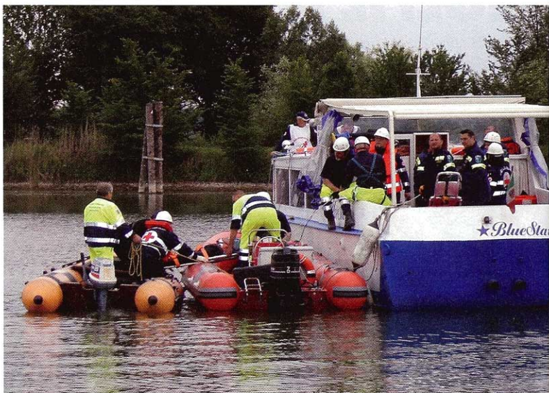
Trasbordo feriti da motonave

te il gruppo utilizza due furgoni, due fuoristrada, una Fiat 'Panda' 4x4, due gommoni (uno in chiglia rigida ed uno a chiglia piatta), tre roulotte più una attrezzata cucina, un gruppo elettrogeno da 10Kw con due torri-faro e due tende.