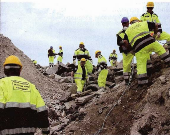
Ricerche su macerie